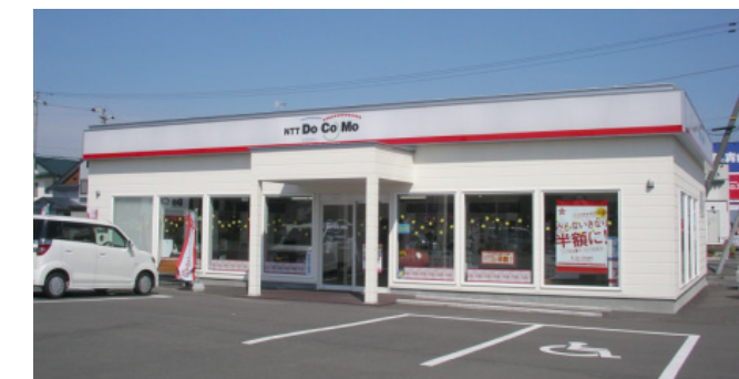
ドコモショップ釧路昭和店