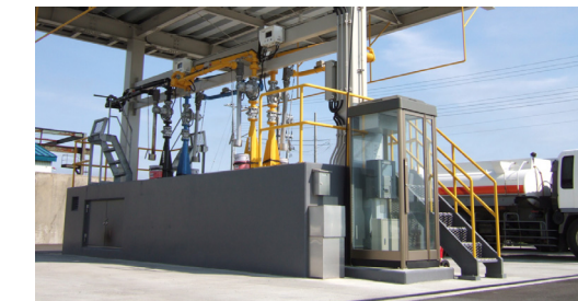
釧路配送センター