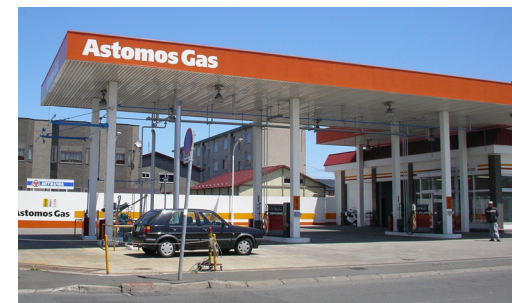
川北オートガススタンド