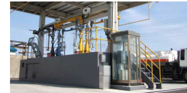
釧路配送センター