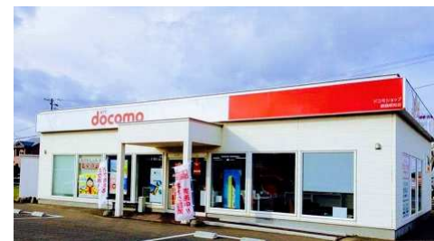
ドコモショップ釧路昭和店