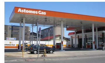
川北オートガススタンド