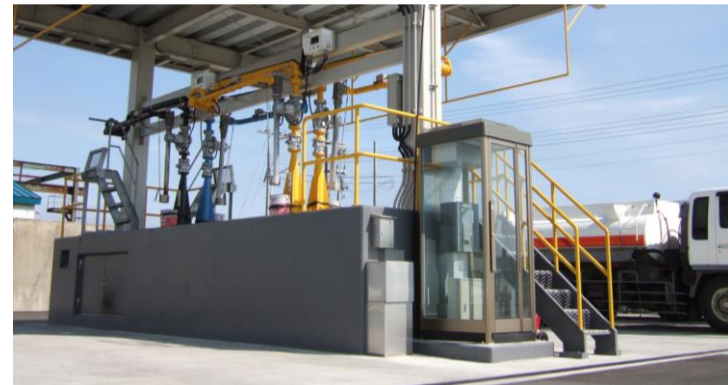
釧路配送センター