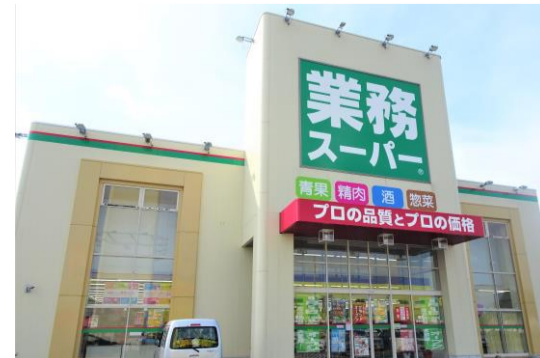
業務スーパー釧路昭和店