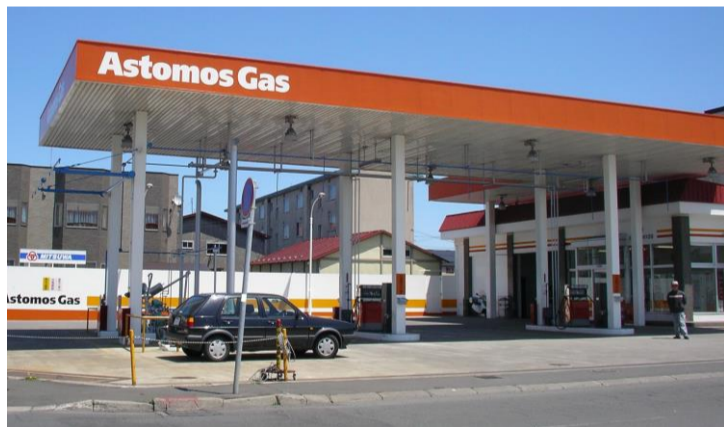
川北オートガスタン্ড